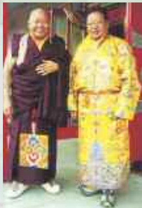
Lama Yéshé Losal Rinpotché et Akong Tulkou Rinpotché

Les centres Samyé Dzong font partie d'un réseau international de centres de méditation représentés dans de nombreux pays en Europe et en Afrique. Tous ces centres sont affiliés à Kagyu Samyé Ling en Ecosse qui est à l'origine et au cœur de ce réseau d'associations. Samye Ling fut le premier centre bouddhiste tibétain créé en Europe en 1967, fondé par Akong Tulkou Rinpotché et feu Tcheugyam Trungpa Rinpotché. Le nom "Samyé Ling", qui signifie "Endroit au-delà ce que l'on peut imaginer", fut choisi en référence au premier monastère établi au Tibet au 8 ème siècle également appelé Samyé.