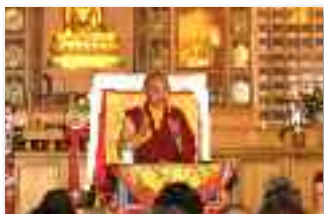
Ringu Tulkou Rinpotché