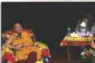
Yéshé Losal Rinpotché