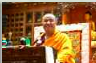
Sangyé Nyenpa Rinpotché