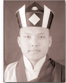
S.S. le 17 ème Gyalwa Karmapa

Le Centre d'études tibétaines de Bruxelles fut inauguré en 1977 par le 16 ème Gyalwa Karmapa, l'un des plus grands maîtres du Bouddhisme tibétain et chef spirituel de la tradition Karma Kagyupa. Le centre est actuellement sous l'autorité spirituelle de son successeur, le 17 ème Gyalwa Karmapa Orgyen Trinlé Dordjé. L'appellation "Samyé Dzong" signifie que le centre est rattaché à Samyé Ling en Écosse, le premier monastère bouddhiste tibétain en Occident, fondé par Akong Rinpotché et Tcheugyam Troungpa Rinpotché en 1967. La plupart des grands maîtres tibétains ayant voyagé en Occident durant ces 30 dernières années ont visité Samyé Dzong à Bruxelles pour y donner des enseignements : le 14 ème Dalai Lama, le 12 ème Taï Sitoupa, Djamgoeun Kongtrul Rinpotché, Dudjom Rinpotché, Orgyen Tulkou, Kalou Rinpotché, pour n'en citer que quelques-uns parmi les plus connus.