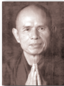
Thich Nhat Hanh