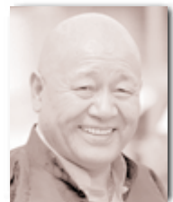
Lama Yéshé Losal Rinpotché

Aujourd'hui, avec l'acquisition de Drî l'Ak, une superbe propriété d'un hectare avec deux bâtiments déjà existants, des perspectives s'ouvrent pour le développement de nouvelles activités. Les citoyens pourront venir profiter du calme et de la beauté de l'endroit pour se ressourcer et trouver un peu de paix. Au mois de juin 2009, Akong Rinpotché a donné à Drî l'Ak une initiation de Tchenrézi, qui fut suivie au mois de juillet par un camp d'été auquel une trentaine de personnes ont participé. Ces événements sont un présage encourageant pour le développement des activités de Samyé Dzong Drî l'Ak dans les années à venir.